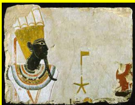
AMON, NETER STELLAIRE.