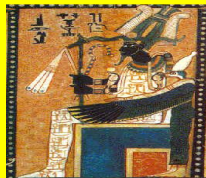
OSIRIS SUR LE TRÔNE DIVIN.

DEUXIÈME SÉANCE LE DIMANCHE 1 ER AOÛT 2010 : THÈME : ORIGINE DIVINE ET CODIFICATION DES RITES SACRÉS DANS LES SANCTUAIRES DE KÉMET.